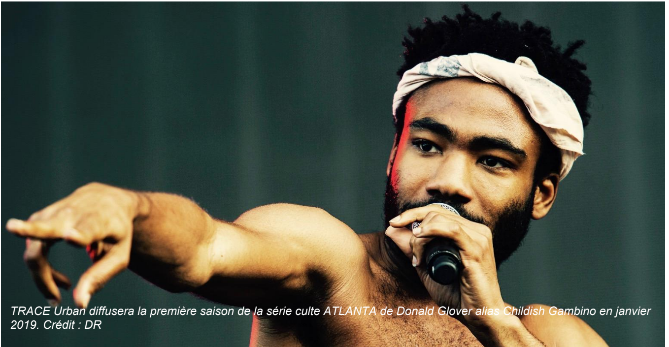
TRACE Urban diffusera la première saison de la série culte ATLANTA de Donald Glover alias Childish Gambino en janvier 2019.